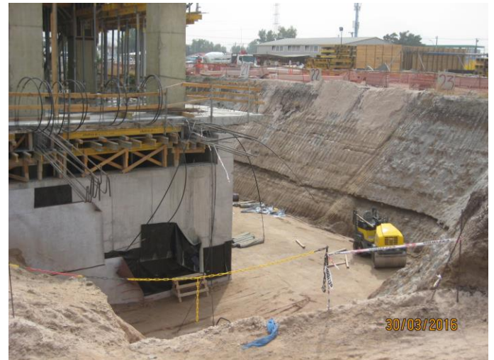
Vista rellenos perimetrales compactados.