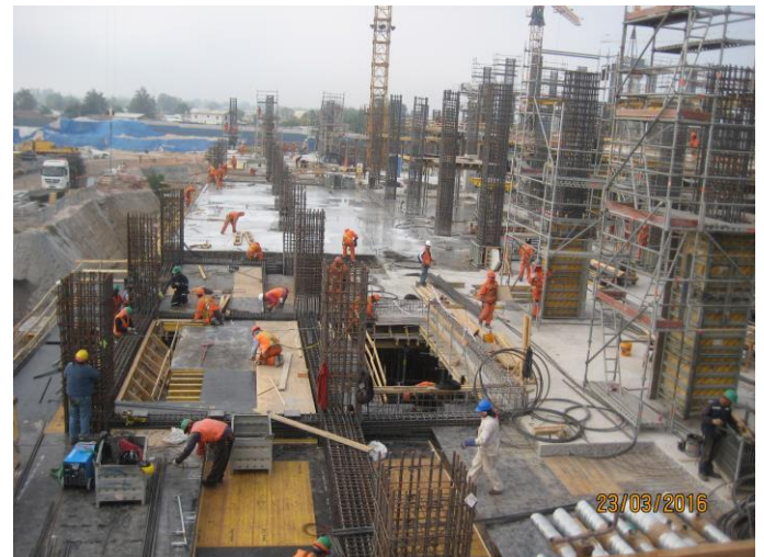
Vista parcial obra gruesa losa piso 2.