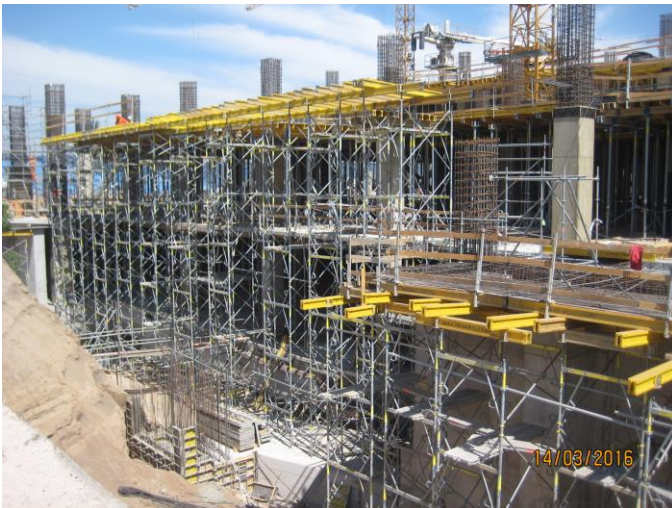
Vista avance de obra sector sur.