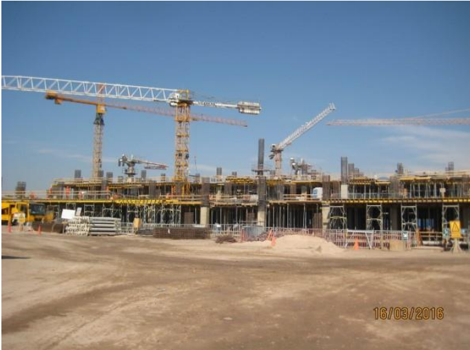
Vista avance obra fachada oriente.