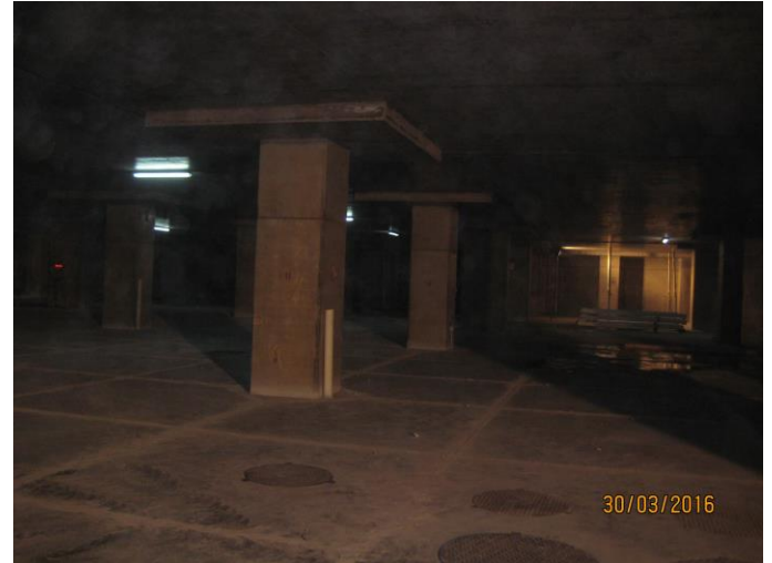
Vista capiteles subterráneo -3