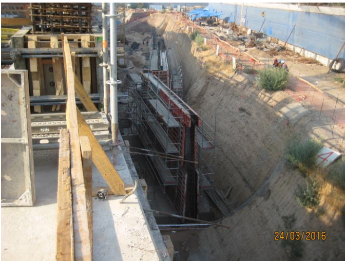
Moldaje de muro de contención del patio de maniobras.